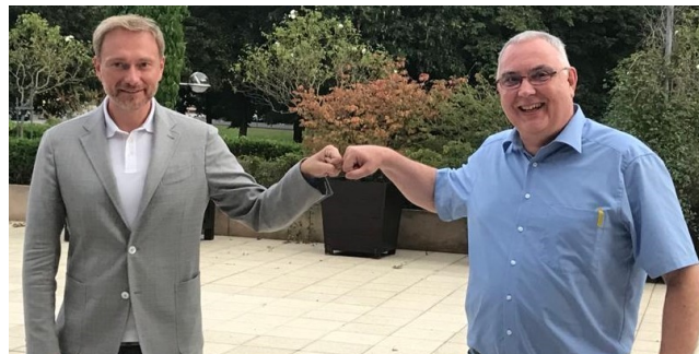
Persönliches Treffen mit dem FDP-Bundesvorsitzenden, Christian Lindner MdB, am 19.08. in Aachen

Ich plädiere ausdrücklich für den Ausbau unseres Vorzeige-Technologiestandortes an der Kaiserstrasse. Der von dort ausgehende Innovationsschub sollte die Attraktivität Kohlscheids zum Wohnen und Arbeiten weiter steigern und gleichzeitig würde das momentan wenig ansehnliche Umfeld im Bereich Kaiserstr./Roermonder Str. deutlich aufgewertet.